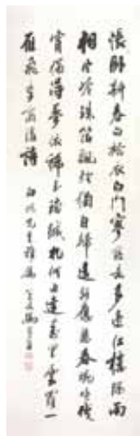
馬壽華 行書中堂 (43.8x138.7cm)