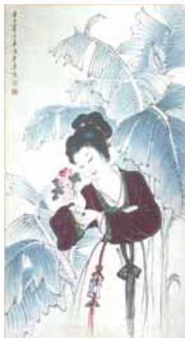
季康 玫瑰仕女圖 (47.8x89cm)