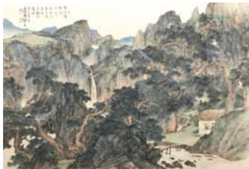
周澄 清客潭玄圖 (65.5x95.5cm)