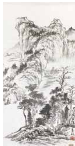
周澄 山水 (30.2x59.5cm)