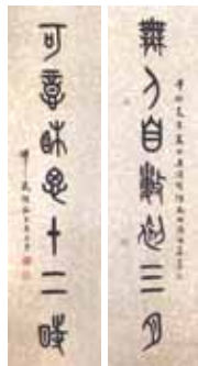
高拜石 篆書對聯 (33x127cm)

冷泡法：7克，浸置700cc過濾純天然熟化涼水，可泡11回左右。 熱泡法：7克，水溫不宜超過90度，約500cc水量，可泡11回左右。