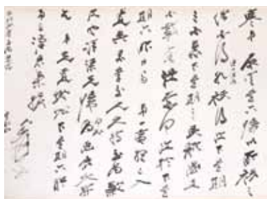
張大千 致張自寒信札 (33x23.8cm)