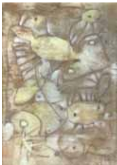
劉其偉 娃娃魚 (35x49.2cm)