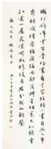
戴蘭邨 行書條幅 (35x102cm)