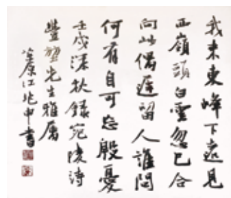
江兆申 行書斗方 (45.3x52.3cm)